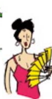
hace mucho calor