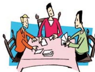
jugar a las cartas