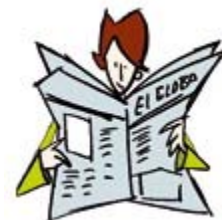
leer el periódico